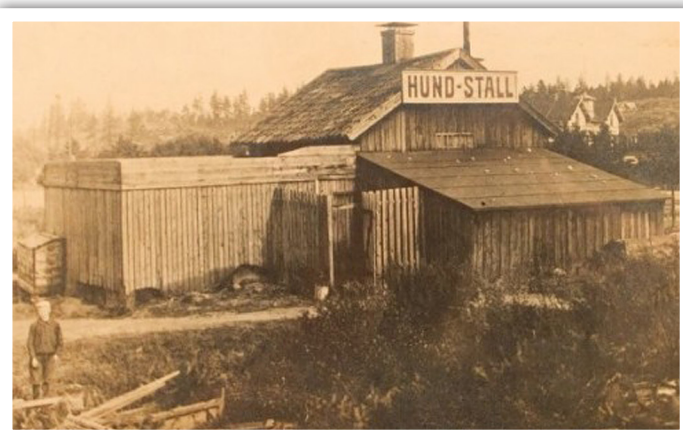
Hundstallet anno 1908

Hundstallet, som egentligen heter Svenska Hundskyddsföreningen, är en ideell förening som bildades år 1908. Så under drygt 100 år har alltså Hundstallet tagit emot hundar och hjälpt dem att hitta nya hem. Hundstallet låg från början på Östermalm i Stockholm, men huserar sedan ungefär 10 år i modernare lokaler i Åkeshov strax utanför stan.